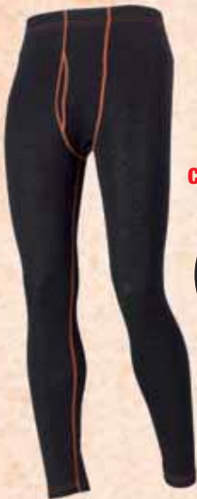
Calz maglia 713FR