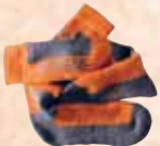
Calze Wool Plus

modo otterrai veri e tangibili benefici contro l'affaticamento, la sudorazione e le irritazioni. Fai respirare veramente il tuo piede, elimina definitivamente i cattivi odori!